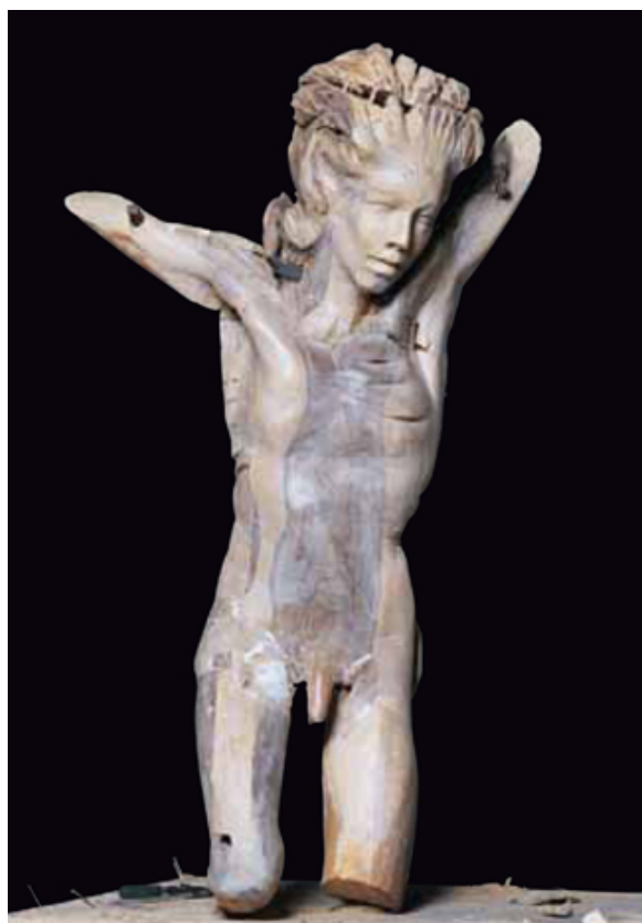
Senza titolo SCULTURA IN LEGNO CM. 200x80x60

gendone con novità di voce, Kokocinski risolve in valori di pittura il proprio ufficio di testimone scomodo del tempo nostro.