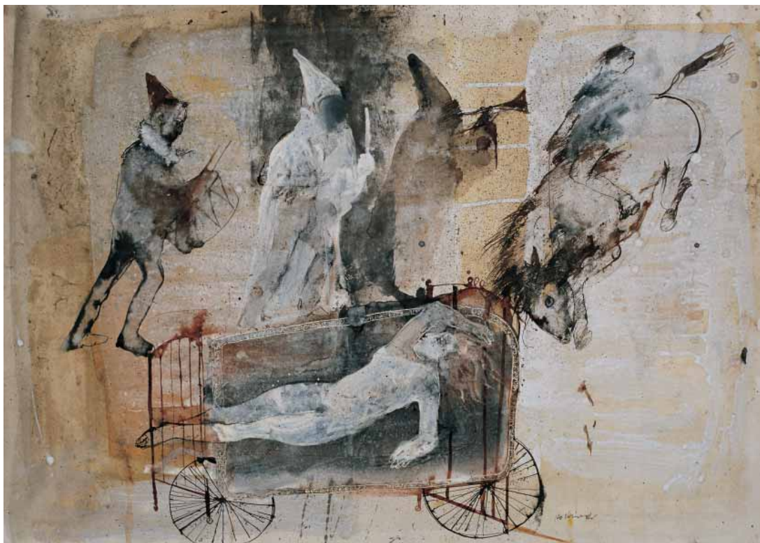
Senza titolo ACQUARELLO CM. 40x50