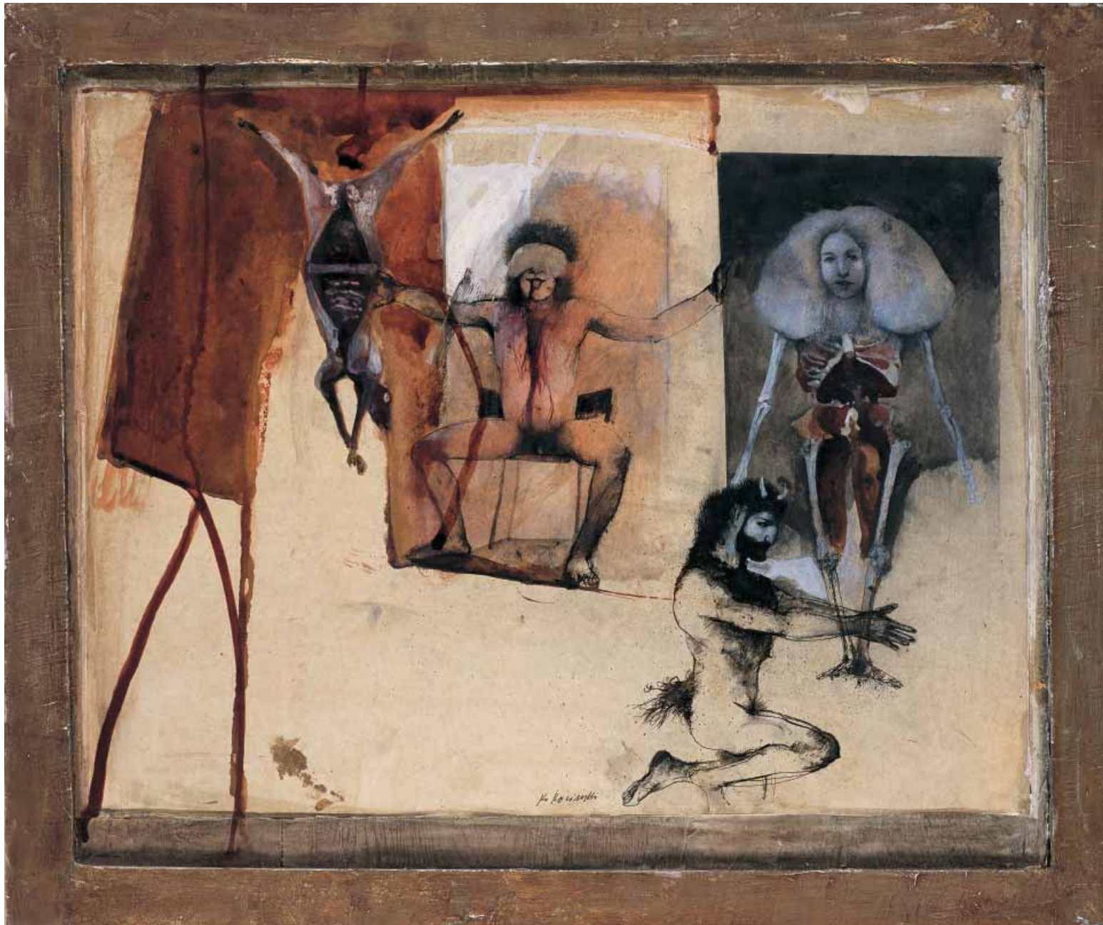
Senza titolo, ACQUARELLO, CM 50X60