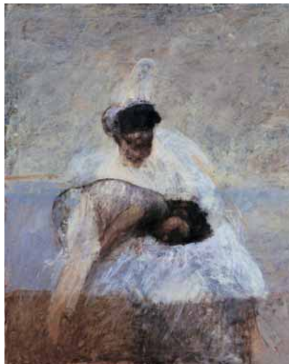
Senza titolo OLIO SU TELA CM. 150x150

L'ho visto a Tuscania mentre restituiva una sua sensazione della gloria garibaldina, affascinato dalla figura epica di Giuseppe e da quella tragica di Anita, coinvolto nell'avventura dell'individualista che diventa motore delle epoche, preso dal viaggio e dalla scommessa posta al limite dell'esistere. Ho visto un russo-argentino-italiano, circense e pittore, scoprire il rito e ridare vita al mito.