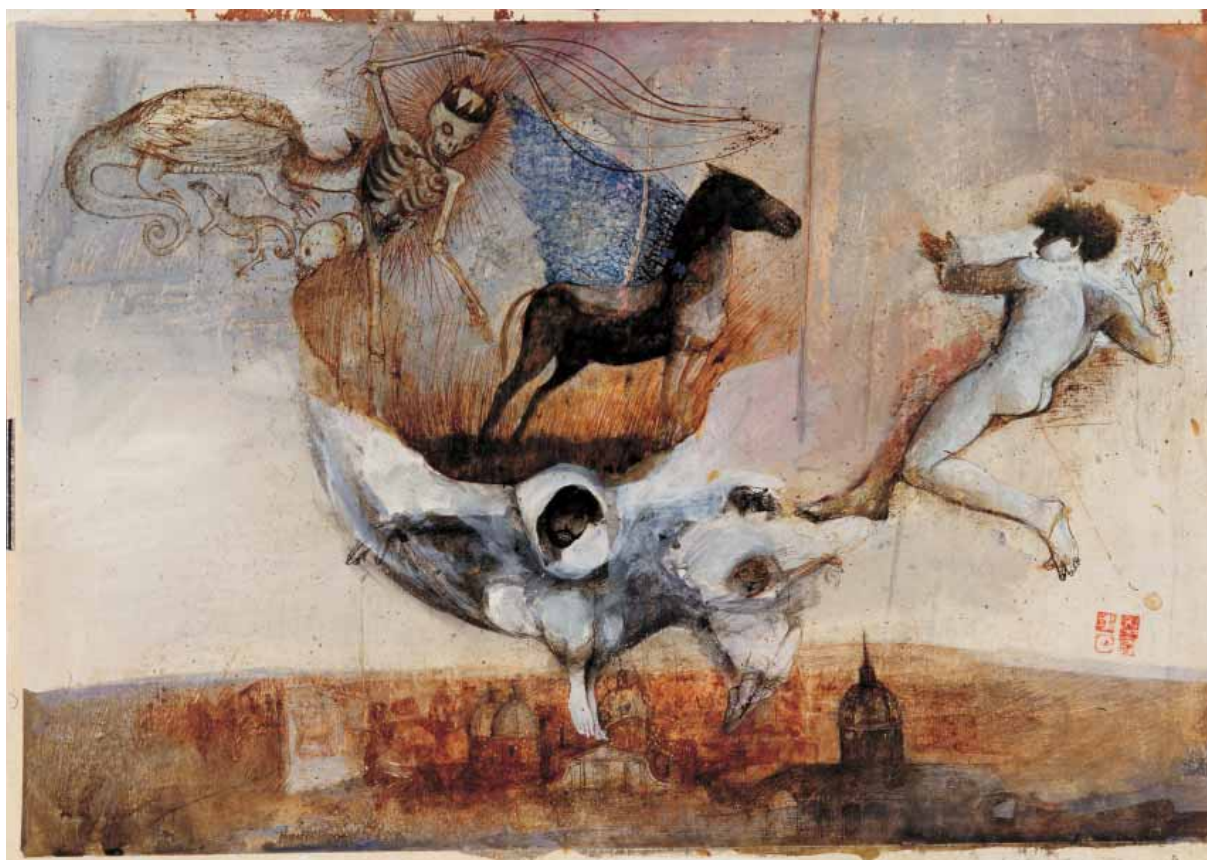
Le nubi su Roma ACQUARELLO SU CARTA CM. 50x60

Con gravità Kokocinski ci assicura che la cattiveria è una componente irrecusabile della vita, quantunque si debba combatterla; e che non c'è forza capace di annullarla nonché di redimerla. Con questo convincimento morale, che fruga legittimamente nel mondo della storia di ieri e di oggi, e che altrettanto legittimamente saccheggia la tradizione figurale antica o recente, emer-