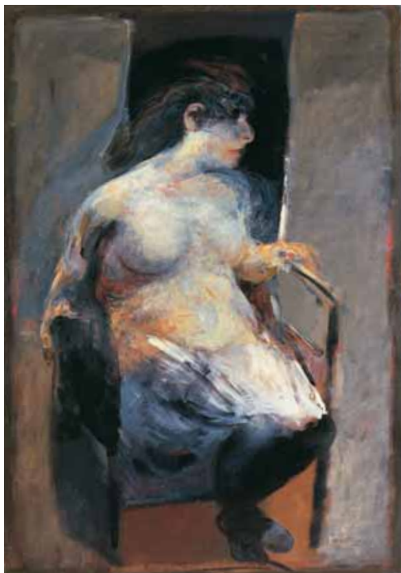
Senza titolo TECNICA MISTA CM. 164x120