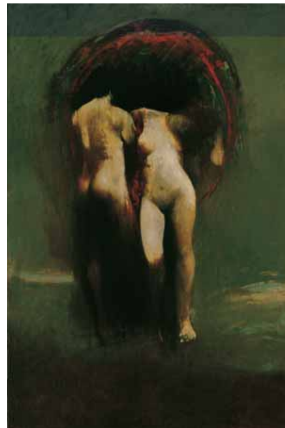
Come quando la frutta matura cade