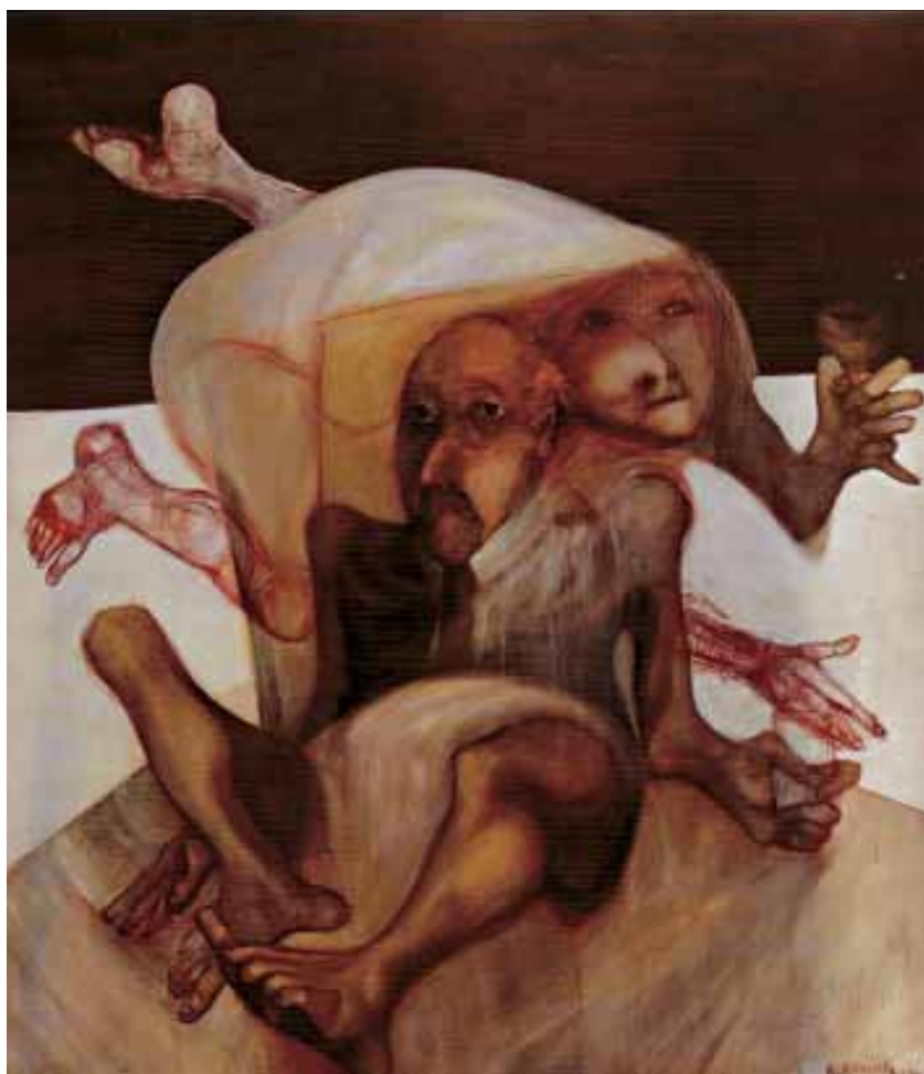
Senza titolo OLIO SU TELA CM. 145x125

S'inarcarna in incubi talora sottili e insinuanti, talora gravi e ossessivi, nelle visioni di Alessandro Kokocinski, che come ha ben saputo "raccontare" Ottaviano Del Turco «spaziano dal tormentato espressionismo ante litteram di Grünewald alle "capricciose" crudeltà di Goya, fino a quelle, taglienti oltre misura, di Grosz...».