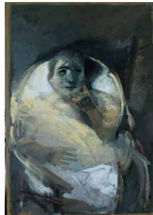
Ritratto nello specchio convesso OLIO SU TELA CM. 164x114