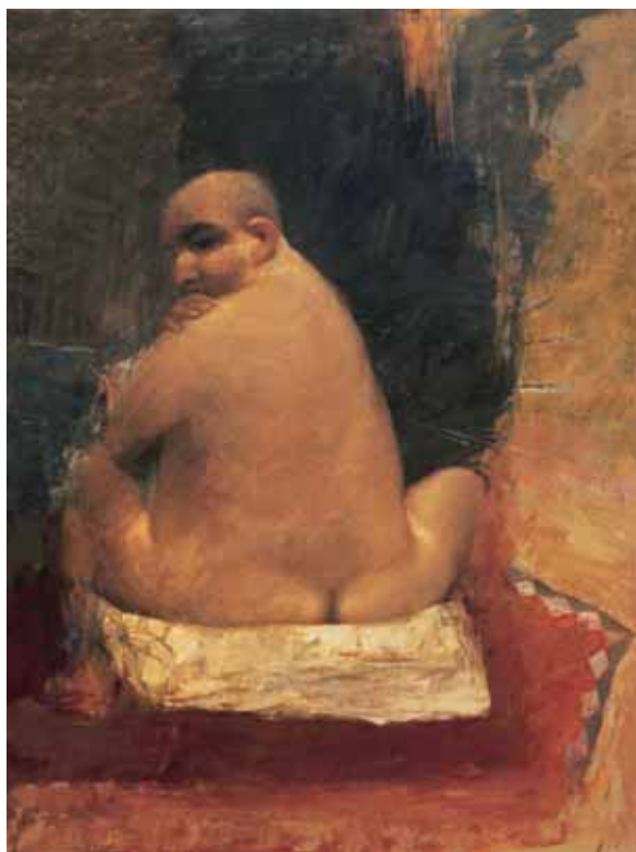
Quando la carne muore, l'anima resta all'oscuro 2001

cinque pannelli della Trasfigurazione uno dei suoi esiti più alti e straordinari. Un'opera d'arte totale in cui pittura e scultura concorrono a dare al tema del sacrificio di vittime innocenti una dimensione quasi sacrale. Con drammatica evidenza plastica corpi nudi, mortificati, consumati, bruciati, escono fuori dallo spazio dipinto, emergendo tra la violenza gestuale e materica che caratterizza le sovrapposizioni cromatiche degli sfondi. Al centro del politico «un Cristo povero, scarnificato, dilaniato [...] colpisce diretto allo stomaco e non lascia il tempo per riflettere, per quanto è chiaro il suo messaggio» (Kokocinski). Al lato, tra le «personificazioni delle angosce e delle violenze dell'umanità», una madre si china dolente sul figlio sottratto alla vita: un disperato urlo di dolore contro le vittime di tutte le guerre, di tutte le dittature e di tutti gli orrori. Come ha acutamente sottolineato Fortunato Bellonzi: «Con gravità Kokocinski ci assicura che la cattiveria è una componente irrecusabile della vita, quantunque si debba combatterla; e non c'è forza capace di annullarla, nonché di redimerla. Con questo convincimento morale [...] Kokocinski risolve in pittura il proprio ufficio di testimone scomodo del tempo nostro».