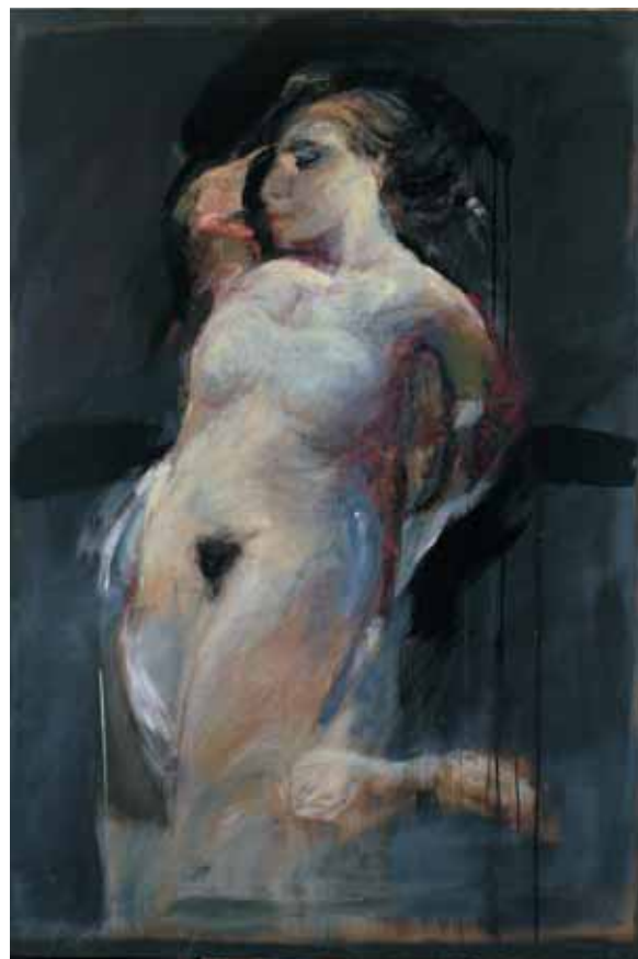
Senza titolo OLIO SU TELA CM. 164x120