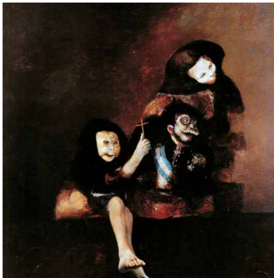
Omaggio a Goya OLIO SU TELA CM. 150x150