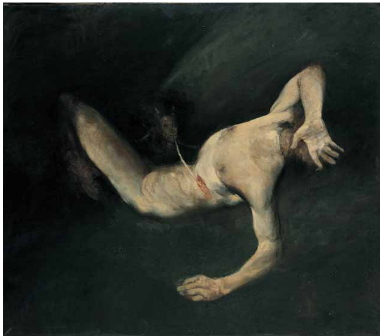
Povera terra mia

ma materica taglia la scena. In una nicchia circolare e oscura sembrano sprofondare le figure di Como cuando la fruta madura, cae , figure umane quasi sempre spezzate, amputate o annegate nel colore. Un'altra figura inclusa in altra, come in un incubo dalle nere ali di Olivando el dolor umano . In La noche suena una bionda fanciulla vestita di un bianco squillante è sovrastata da una nera figura come in una rievocazione certo non testuale, dell' Incubo di Füssli. Così efficacemente Bruno Mantura descrive la scena delle opere di Kokocinski: «La escena representada sobre la superficie es un gran espacio vacío. Kokocinski parte desde este amplio vacío. Este espacio tiene por lo general una iluminación nocturna o, para mejor expresarlo, está invalido por la oscuridad y es, aquí y allá, surcado por haces de luces». Un vuoto spazio notturno. Il fatto è che questo spazio scarso, compreso e angusto delle ambientazioni di Kokocinski è nella più probabile delle ipotesi quello del sogno. La dimensione onirica infatti si presenta come una scena quasi nuda dove emergono isolati dettagli e regnano i meccanismi della condensazione [...]