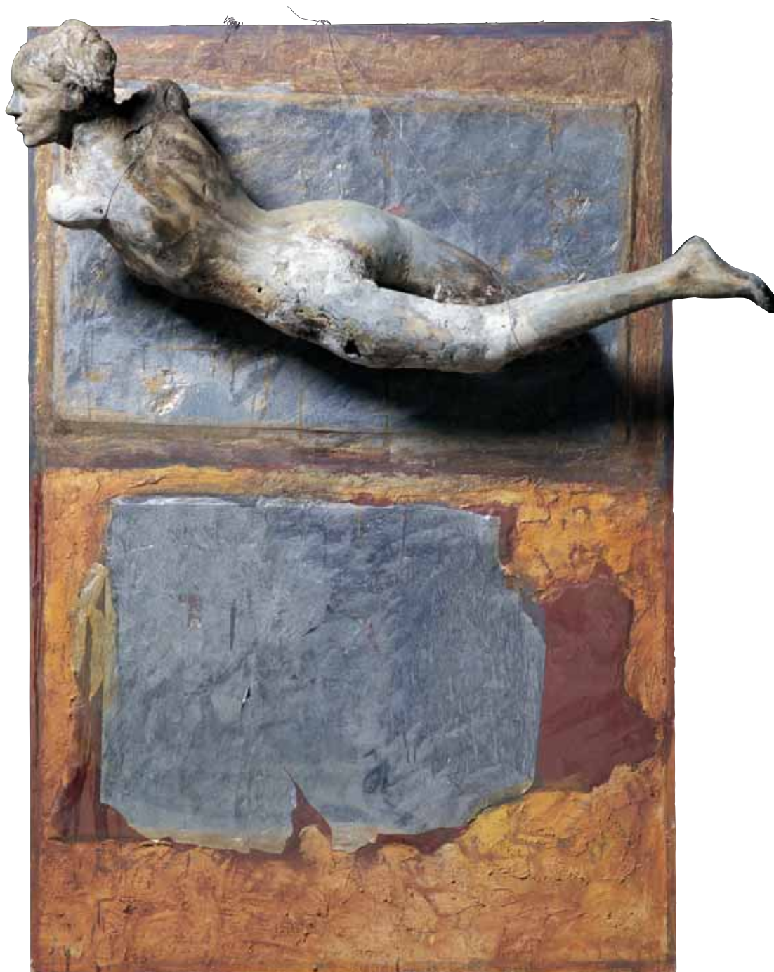
Forio d'Ischia, nel sogno, che non fu VETRORESINA CM. 160x80x60

gure in rilievo (vetroresina), come se fossero cadute dallo schermo cinematografico di Woody Allen o come gli attori dell'opera di Pirandello in Sei personaggi in cerca di autore , ma nello stesso momento riman-