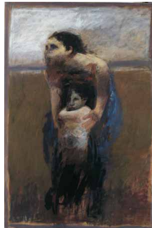
Senza titolo OLIO SU TELA CM. 194x130

[...] E proprio esaminando i molti e grandi quadri prodotti nella solitudine continua e raccolta – torno al primo incentivo della mia riflessione – ho potuto intendere la misura, veramente eccezionale, dell'intensità visuale di Kokocinski, verificando cioè gli strati della sua cultura come memoria, quali si presentano divenendo componenti attive dei drammi pittorici.