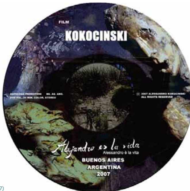
DVD DEL FILM Alejandro es la vida (1997) DI ALESSANDRO KOKOCINSKI

Casi impassible, mudo, silencioso, Alejandro es la vida, joven, dura, dura demasiado, abiertamente oscura, ángel obrero en rauda y triste acoso, tierno, pobre, feroz, desesperado, luminoso, mordiente, esperanzado, sumergido, emergido de las más rotas realidades, agónicas profundidades, de este dolor, este estampido que es hoy la tierra, el viento que lo lleva y lo trae en sacudido movimiento, la mano firme, zarpa y ala en guerra, que dibuja, contrae, aprieta, estruja y que casi goyescamente espanta en un mundo desnudo, que te echa un nudo en la garganta.