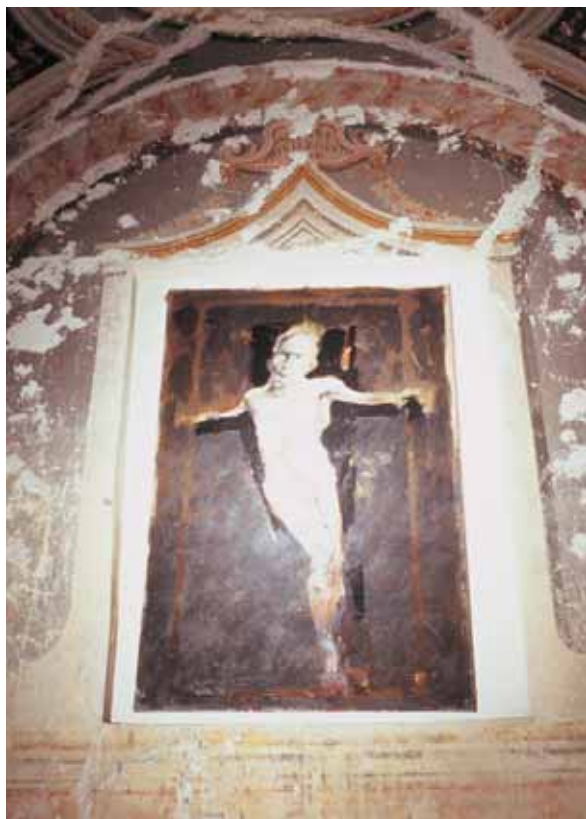
Senza titolo TECNICA MISTA CM. 200x300

LO STUDIO DI KOKOCINSKI NELLA CHIESA DI SAN BIAGIO A TUSCANIA